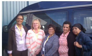
Pais do BAArc participaram na Conferência sobre Transição