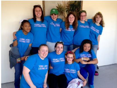
Jovens Senhoras Grupo Latching Arms

Nosso Centro de Apoio as Famílias e financiado em grande parte pelo DDS